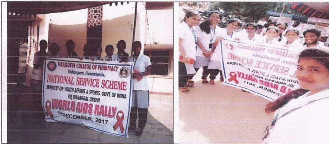
HIV/AIDS Awareness Rally on 1-12-2017