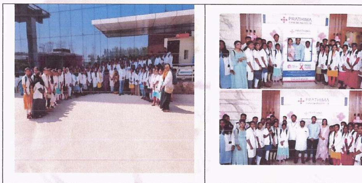
Cancer Awareness Programme on 4-2-2022

The Blood donation done on 17-4-2022, cancer awareness programme on 4-2-2022, HIV/AIDS awareness rally on 31/03/2022, Eye Check-up Camp on 16-7-2021, Eye Check-up on 9 & 10-4-2021at, Breast cancer awareness rally on 04/02/2021, Free medical and dental check-ups on 2-3-2020, HIV/AIDS awareness rally on 30/11/2019, Diabetes Screening on 14/11/2019, Eye Check-up Camp on 22-12-2018, World glaucoma week awareness rally on 15/03/2018, Blood Donation Camp on 23-4-2018, Free Dental Camp on 07/12/2017, HIV/AIDS awareness rally on 1-12-2017, Diabetes screening and Hypertension screening in 14/11/2017, Health camp on 5-04-2017, Hypertension Screening in Health Camp on 5-04-2017 and Blood Sugars Check-up in Health Camp as a part of Diabetes screening camps were organized in various rural places which are nearby our college.