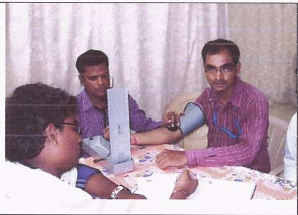
Hypertension Screening in 14/11/2017