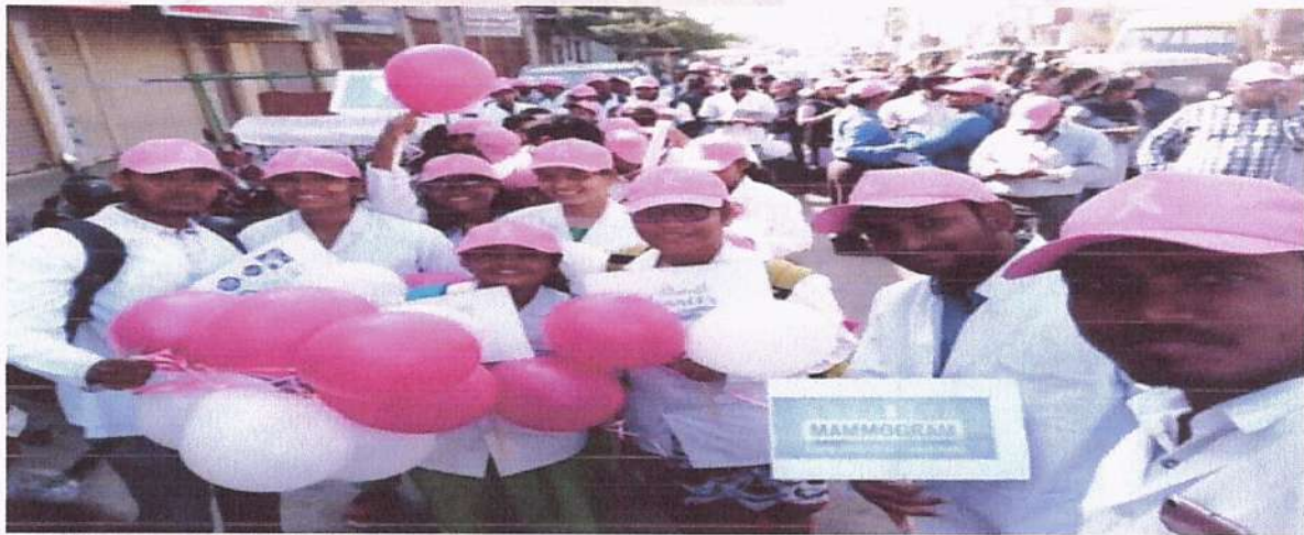
Breast Cancer Awareness Rally on 04/02/2021