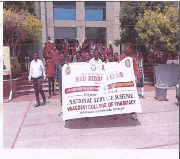
HIV/AIDS Awareness Rally on 31/03/2022