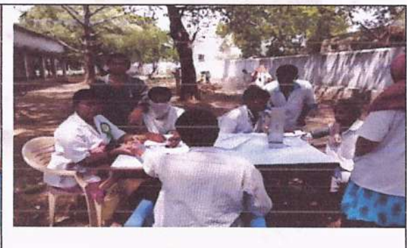
Hypertension Screening in Health Camp on 5-04-2017 at Madikonda

Principal Vaagdevi College of Pharmacy Hanamkonda, Warangal-506 001