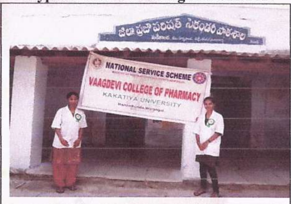
Health Camp in Madikonda Village on 5-04-2017