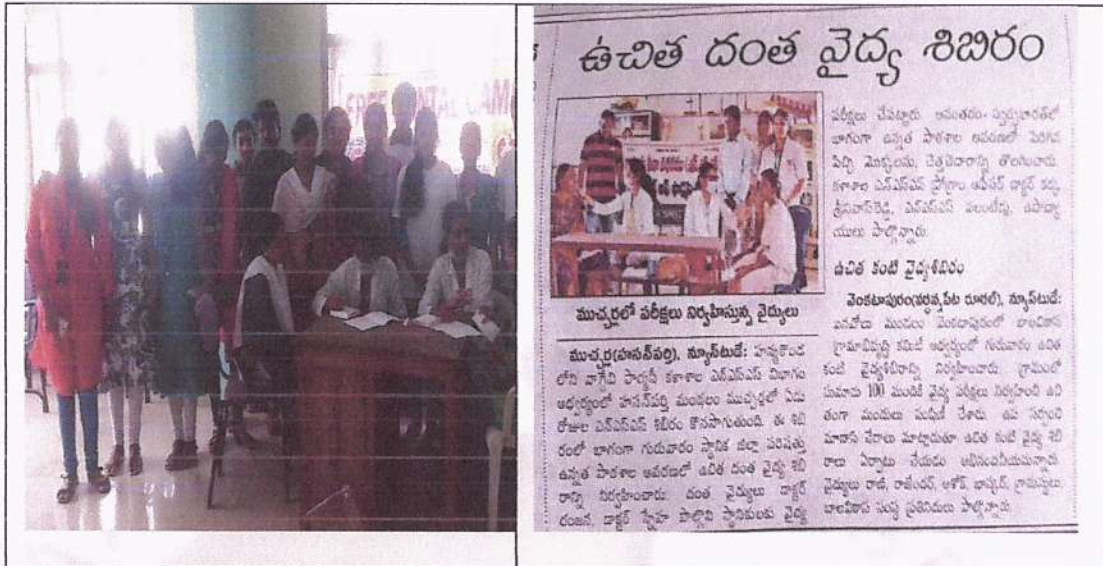
Free Dental Camp in Mucherla on 07/12/2017