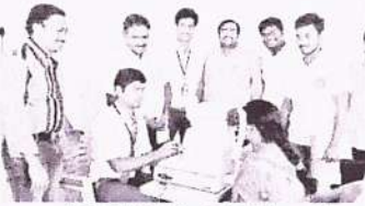
ఉచిత కంటి పరీక్షలు నిర్వహిస్తున్న డాక్టర్లు