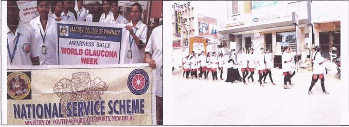
World Glaucoma Week Awareness Rally on 15/03/2018