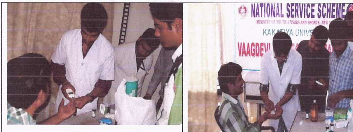
Diabetes Screening on 14/11/2019