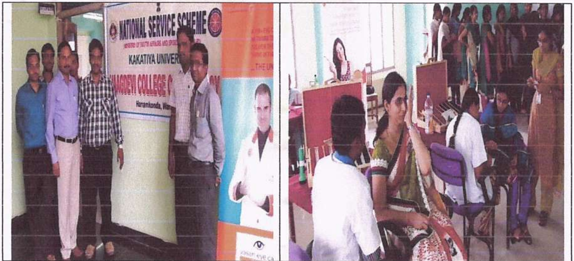
Eye Check-up Camp on 22-12-2018(Keshavapuram)