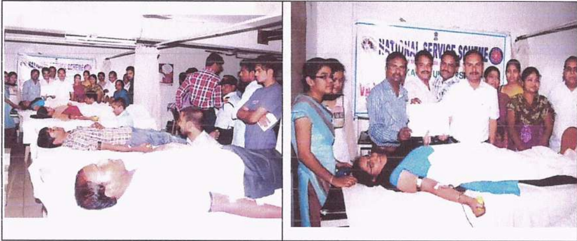
Blood Donation Camp on 23-4-2018 Battupally PHC