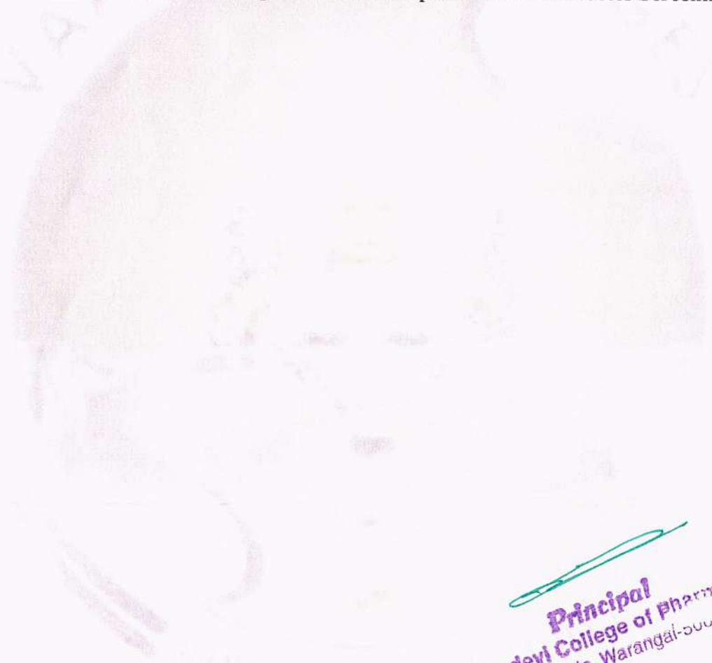
Blood Sugars Check-up in Health Camp as a Part of Diabetes Screening

Principal Vaagdevi College of Pharmacy Hanamkonda, Warangal-508 001