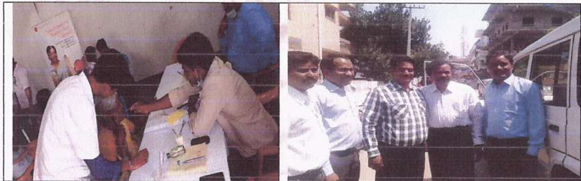
Free Medical and Dental Check-ups in Madannapeta, Kamalapur Mandal on