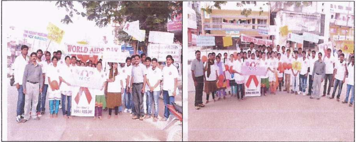
HIV/AIDS Awareness Rally on 30/11/2019